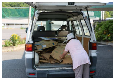
ダンボールの積み込み