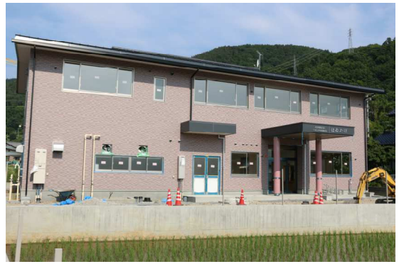
はなたば全景(2017年6月20日現)

“はなたば”の内覧会では、仲間たちが過ごす施設の設備や内部の様子をご覧頂く機会として、多くの皆様にお越し頂ければと思います。ご来場お待ちしております。