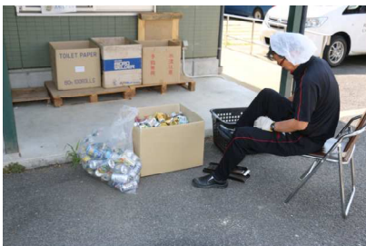
アルミ缶つぶしの様子