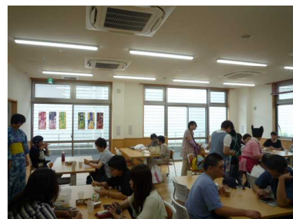
はなたば 内覧会の様子