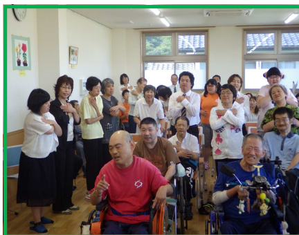
仲間と職員の合唱