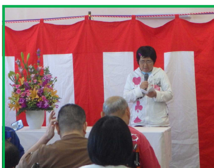
「はなたば」の仲間を代表して挨拶