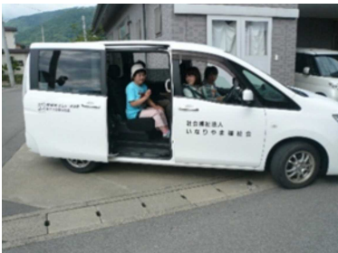
朝の送迎風景 (各事業所に皆さんを送ります)