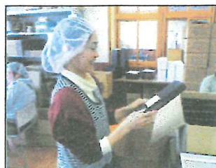
いなりやま共同作業所 勤務

まだ慣れない点、分からない点も多いですが、学びながら十二分に励んでいきます。宜しくお願い致します。