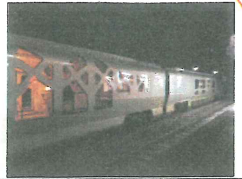
TRAIN SUITE 四季島

皮むきは、キッチンで使用するピーラーを使い、杏の枝一本一本の皮をむいていきます。ピーラーを初めて使用した仲間も最初は恐る恐るでしたが今ではさっとむくことができるようになりました。杏の枝も、柔らかいうちに皮むきをしないと乾いて硬くなってしまうので、土曜日などお休みを返上して作業を進めています。